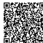
Weiteres Zubehör im Katalog